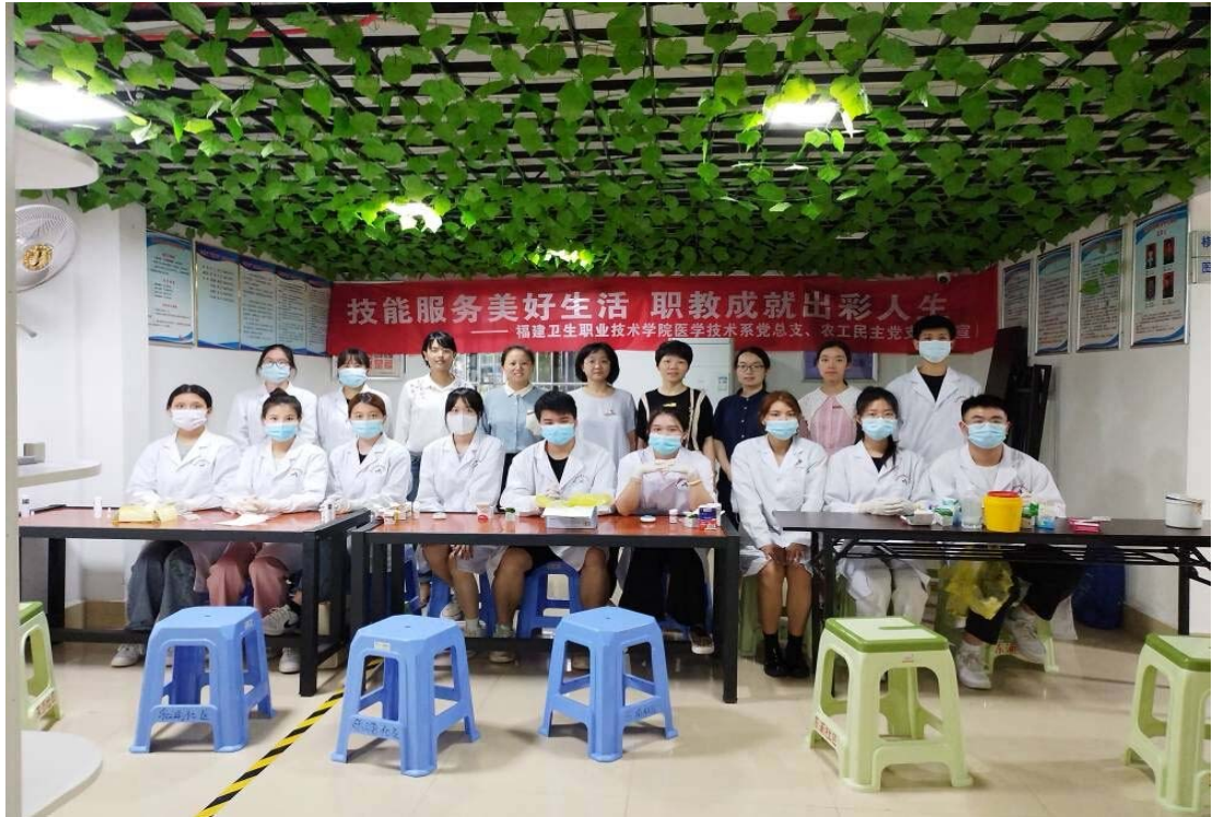
图 2-1 端午“安”“康”职业技能进社区服务活动

展省育婴员、养老护理员职业技能等级认定和制作药膳、药囊等职业体验活动；开展牙体雕刻等专业技能竞赛活动；与 15 家企事业单位共同开展校企主题活动。