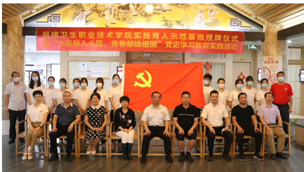
图 8-2 实践育人示范基地授牌仪式

学校药学院第一党支部联合福建瑞来春健康管理有限公司及多家业内知名企业积极探索深化产教融合、校企合作的新路径和新方法，围绕“党建业务齐抓共管、产教融合强基赋能”的工作思路，倡导“大党建”管理理念，构建“四元并举、五措合一”模式，紧扣“人才培养、就业创业、社会服务、文化传承”四个领域，落实“党建共建强化认同”“做精专业找准定位”“培优双师强化技能”“以赛促学明德精技”“联袂培训优势互补”五项举措，助力产教融合不断走向深入，在带动支部党建和思想政治工作质量提升的同时，助力学校“双高校”建设中心工作，切实提高中药学专业人才培养质量。该项目获中共福建省委教育工委公布高校党支部工作“立项活动”优秀成果二等奖。