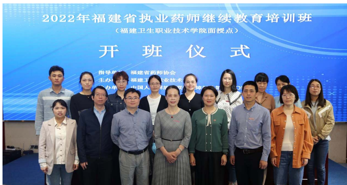
图 8-9 2022 年福建省执业药师继续教育培训班

做优服务，向药师培训要效能。培训前，通过精准发送短信方式，为药师们推送报名通知、操作流程，指导报名，做好报名前服务工作；训中，每天反馈一次学习动态，帮助药师们及时了解学习情况，做好培训各项计划；训后，开展调研，延伸培训服务半径，提升培训服务水平。