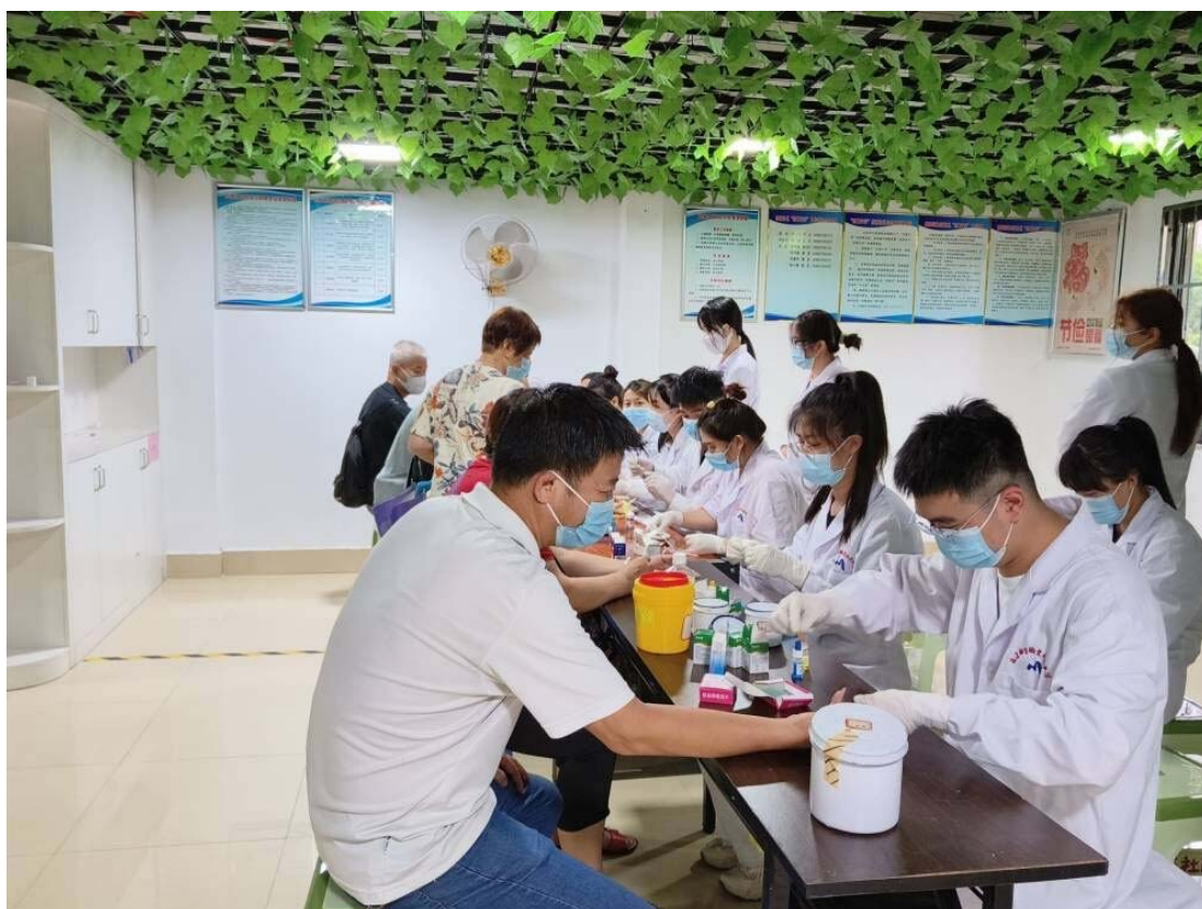
图 8-4 师生为居民提供医疗检测服务

康健指导，暖心宣传。师生们为社区居民科普艾草的功效和作用，宣讲健康饮食、科学作息等知识，指导居民健康过端午。