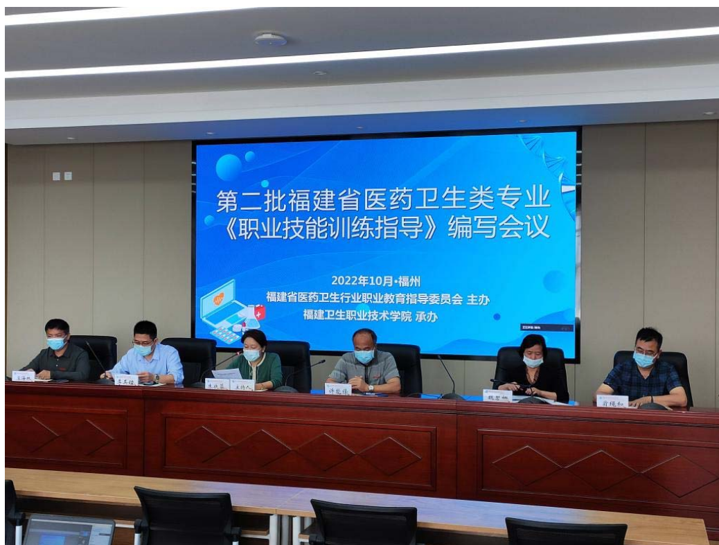
图 8-7 医药卫生类专业《职业技能训练指导》编写会议

10月27日，第二批福建省医药卫生类专业《职业技能训练指导》编写会议在福州召开，我校作为福建省医药卫生行业职业教育指导委员会秘书处单位主办本次会议。