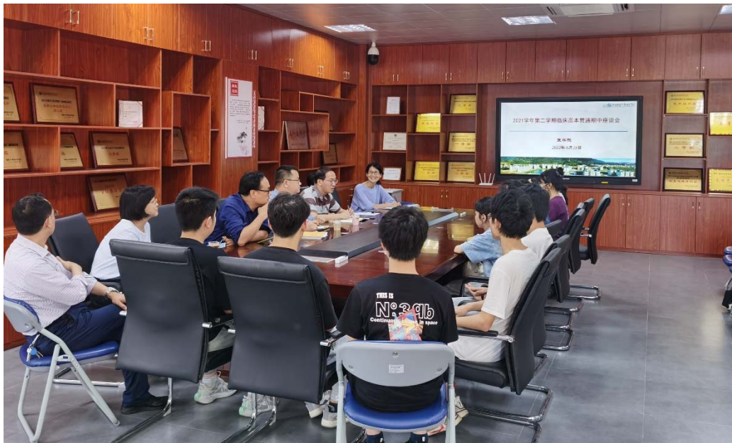
图 6-2 2021-2022 学年第二学期高本贯通临床医学专业期中座谈会

中学生座谈会；在期末，主要检查教研室的工作计划施行情况和教师的学期教学进度完成情况。本年度督查发现，教学管理总体情况较好，发现个别问题都能及时得到整改。