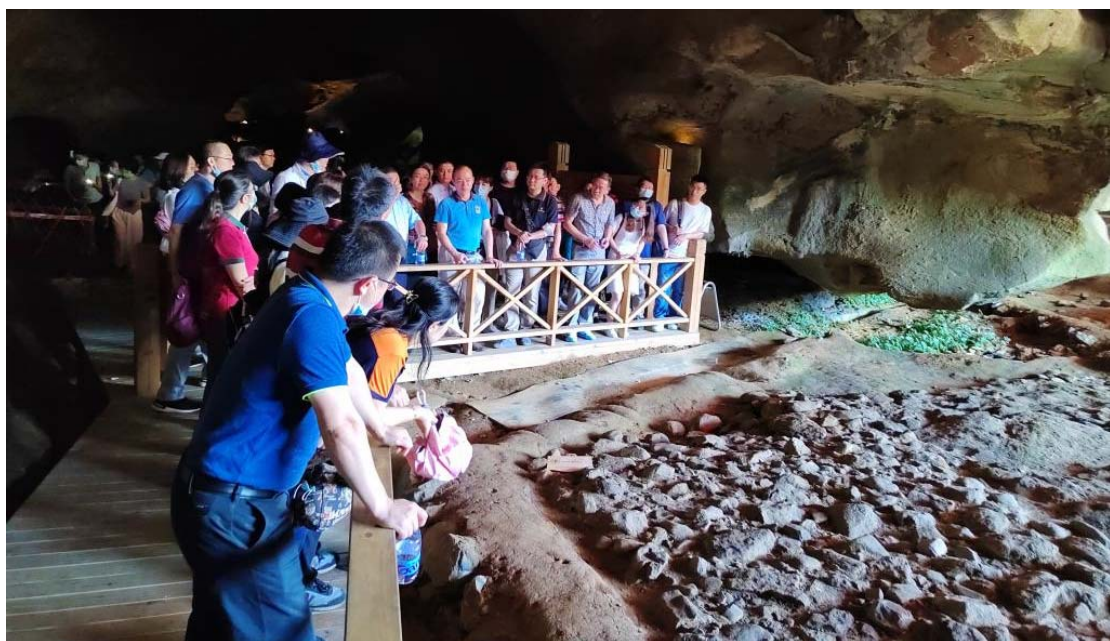
图 8-1 暑期党政干部研学团前往万寿岩遗址现场学习

2022年7月，学校先后组织党政干部、思政教师、青年团员骨干等多种类型人员赴三明革命老区开展集中学习培训，组织4场辅导报告、8次现场教学、将《闽山闽水物华新——习近平福建足迹》等原著学习与追寻习近平福建足迹、感悟新思想实践伟力有机结合，有效提高党员干部党性修养、激发学习新思想的热情、增强责任担当意识。