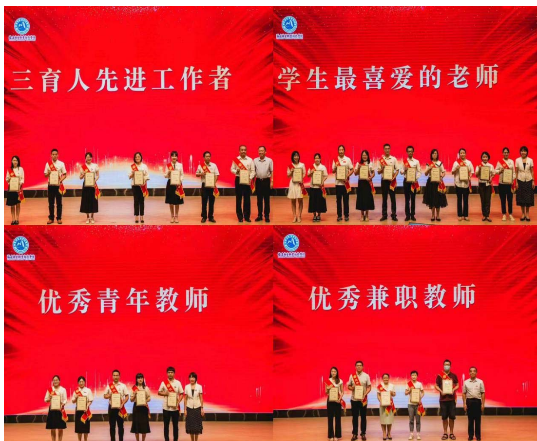
图 8-6 2022 年教师节表彰大会

为进一步推进学校教师思想政治和师德师风建设工作，学校不断完善教师评优评先机制，建立健全教师荣誉制度。连续三年开展“学生最喜爱的老师”、“优秀青年教师”、“三育人先进工作者”和“优秀兼职教师”的评选活动，2022年共评选表彰41名先进典型，举办教师节表彰大会、“为教师亮灯”等教师节系列活动，利用公众号、校园网和宣传栏等广泛宣传教师优秀事迹，以简朴隆重的方式，强化尊师教育，厚植师道文化。