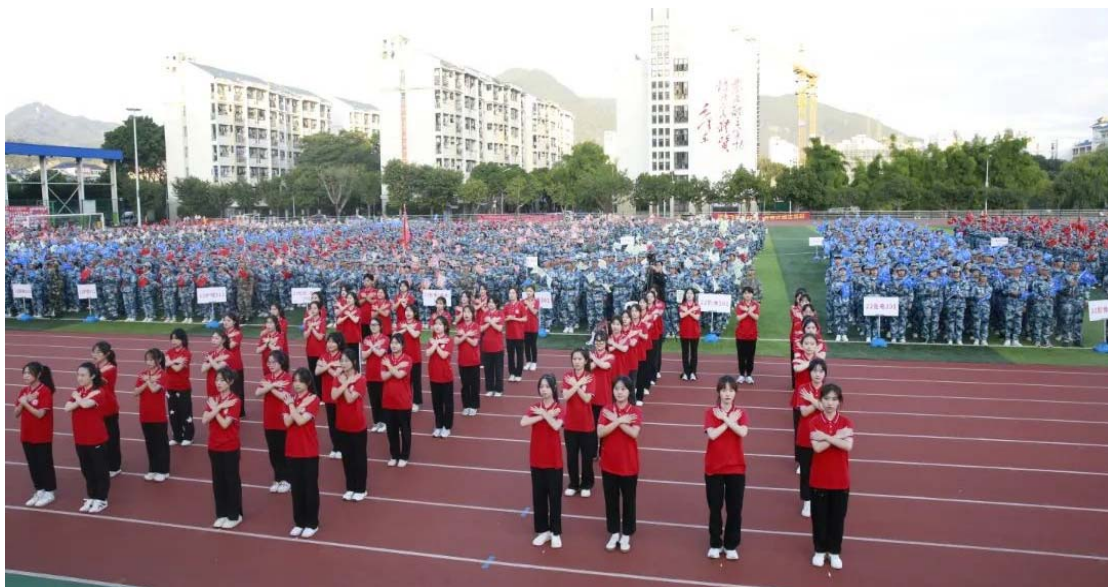
图 2-2 2022 年新生开学典礼上的手语表演《仁心如花》

学校致力于培育先进典型，注重用好身边的感化力量，发挥同辈引领作用，用榜样的力量引领学生成长成才。2022 年五四表彰活动共表彰校内外各级各类竞赛中获奖学子 4042 人次，2022 年我校学子获省部级表彰共计 297 人次。2022 年拍摄新生宣传片《仁心少年 医往无前》，引领新生学子积极向上的精神面貌，培养家校情怀，树立理想目标。凝练德育特色案例《青春逢盛世 奋斗正当时》，勉励闽卫学子秉承业精德诚的校训，励学笃行，努力书写属于自己的人生新篇章。