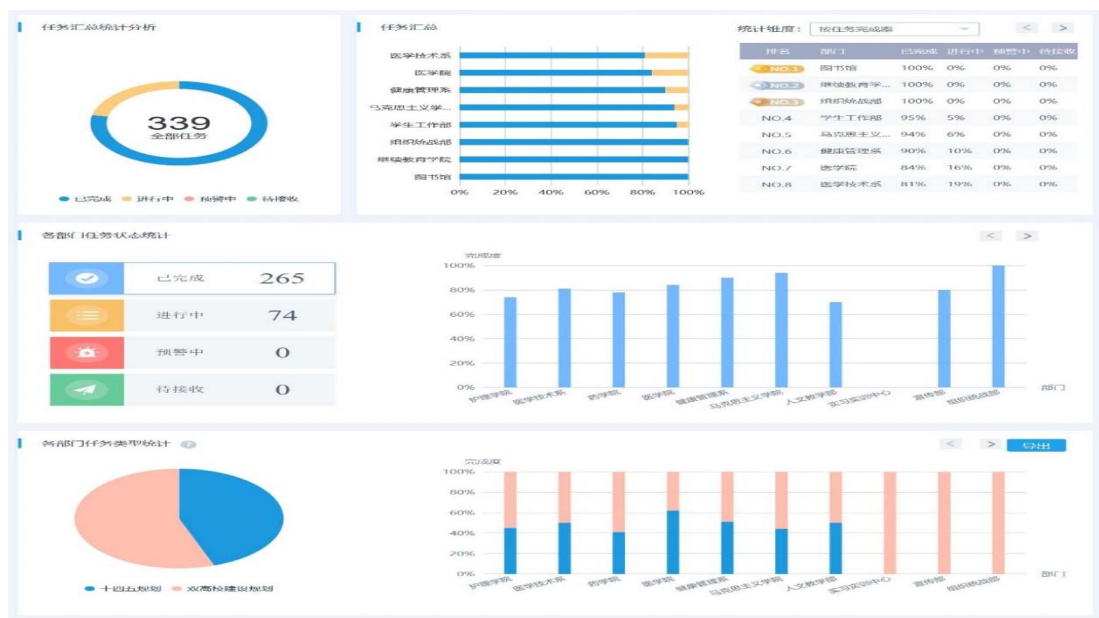
图 6-1 学校 339 项重点任务完成情况

为保障，以专业诊断与改进为切入点，构建学校、专业、课程、教师、学生等五个层面学校内部质量保证体系。本年度学校各部门、专业团队、课程团队、教师、学生五个质量保证主体，利用质量管理信息平台，实时采集状态数据，对照发展规划和诊断点，实施自我诊断、自我预警、及时纠错，完成 339 项重点任务、23 个专业、784 门课程、256 位教师的诊改工作，有力推进学院教育教学质量的提高。该项工作本年度通过福建省职业院校教学工作诊断与改进省级复核评审。