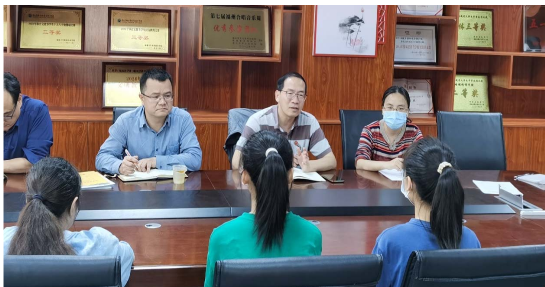
图 8-8 高本贯通临床医学专业期中座谈会

为促进师生的沟通与交流，提升教学质量，医学院于2022年4月28日下午在实训楼311会议室召开师生期中座谈会。会议由学校质量管理办公室，医学院教学管理负责人、临床医学专业负责人、专业教师代表以及高本贯通临床医学专业学生代表共同参加会议。会议围绕提高教育教学质量开展进行交流与讨论。首先，由学生代表对教学情况进行发言，同学充分肯定了任课老师的理论水平和授课表现，也提出存在的情况：一是学习方法问题，一些同学至今未找到合适的学习方法；二是对不同老师的上课风格接受度不同。接着，专业教师对上述问题分析原因，指导同学如何选择参考用书，进行自学补缺补漏，将老师上课教的思维导图等方法化为自己的学习方法等。交流会后质量管理办公室和医学院负责人就如何提升专业教学质量，提高管理水平等问题进一步探讨。