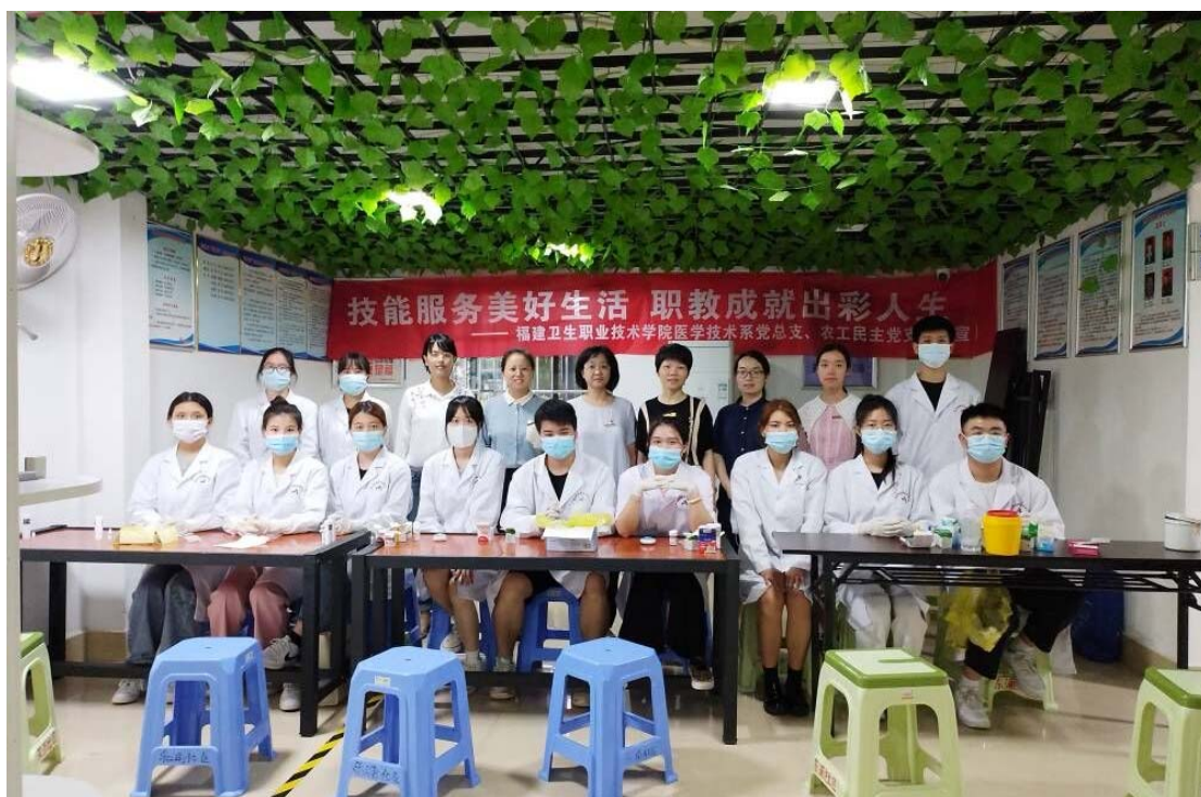
图 8-3 端午“安”“康”职业技能进社区服务活动

安全用药，防疫科普。师生们开展健康义诊，为群众测量血压，细心问诊，给出专业就医指导意见，积极进行科学防疫知识科普，向居民表达端午节日的祝福，共筑安全和谐的节日氛围。