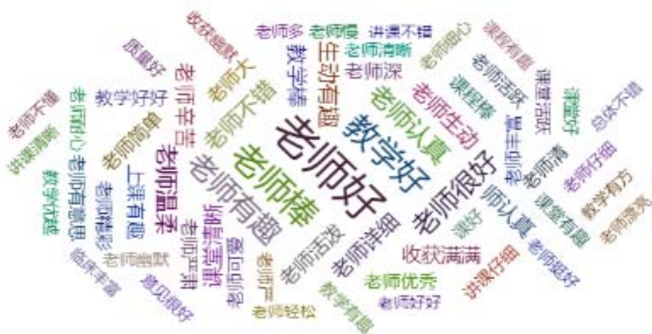
图 6-3 2022 年福建卫生职业技术学院“学评教”词云图

学校重视教育教学质量的评价,采用了学生评教、同行评教、校领导评教、学生家长、教职工等多种角度对教育教学进行评价。