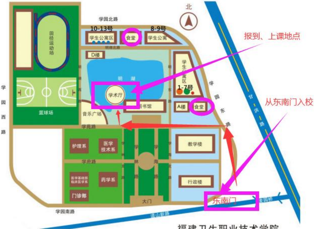
福建卫生职业技术学院 (平面示意图)